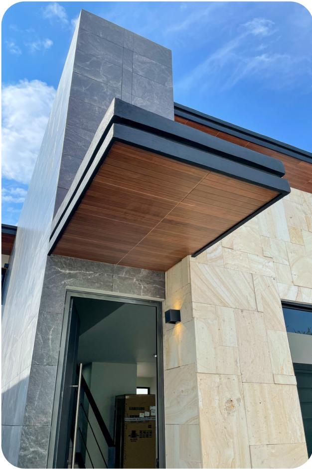
Acceso a casa