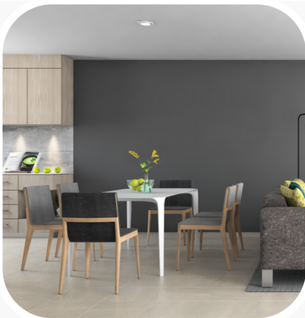
Comedor unido con sala