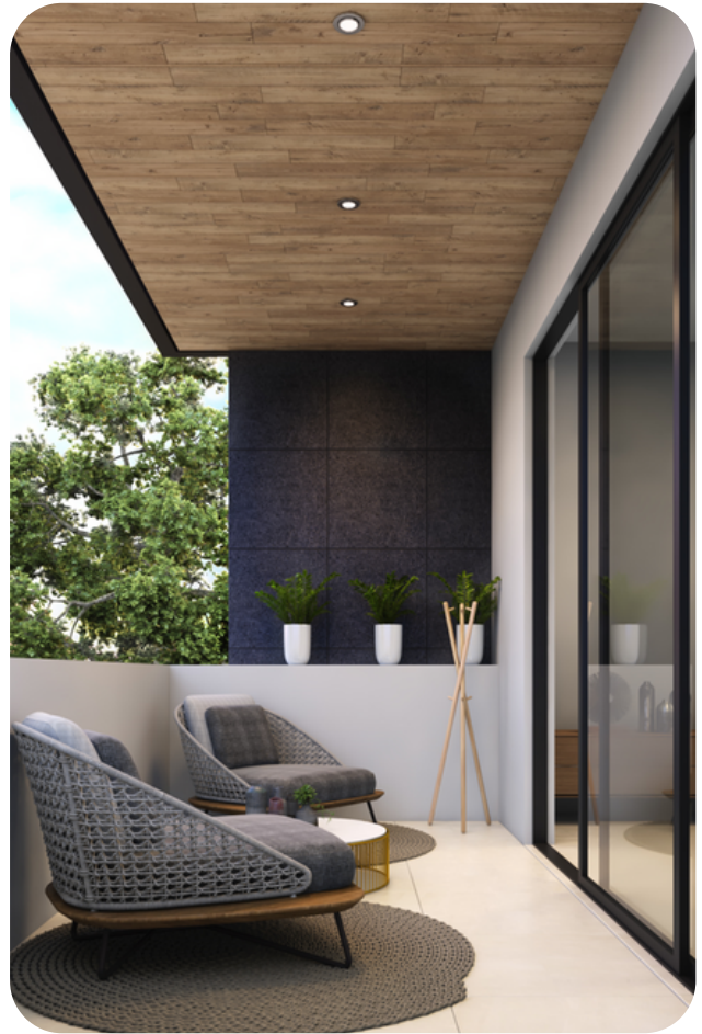
Terraza de recamara principal